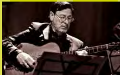
4 coins du monde Rue Léon Theodor, 132 / 21h - 00h