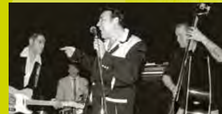
Le Breughel Place Cardinal Mercier, 23 / 21h - 00h