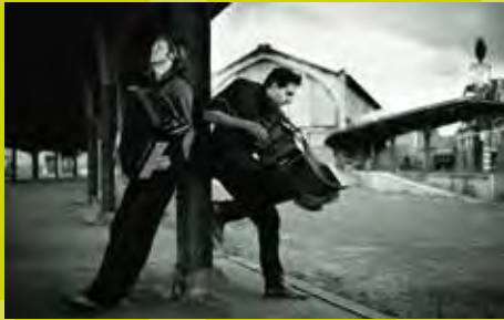
Le Rayon Vert Rue Gustave Van Huynegem, 32 / 21h - 00h