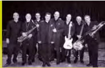
Le Miroir 1 Place Reine Astrid, 24 / 21h - 00h