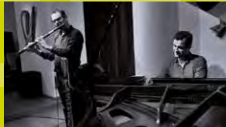
Gavilan Rue Ferdinand Lenoir, 21 / 21h - 00h