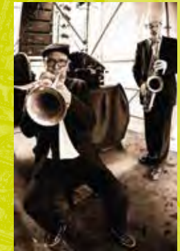
Welkom Place Cardinal Mercier, 30 / 21h - 00h