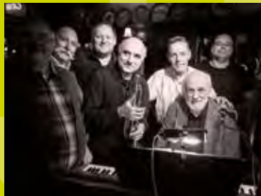
Le Central Place Laneau, 1 / 21h - 00h