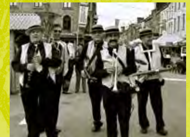
Op den Hoek Place Cardinal Mercier, 32 / 21h - 00h