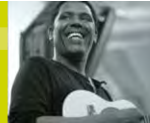
L'Excelsior Rue de l'Eglise Saint-Pierre, 8 / 21h - 00h