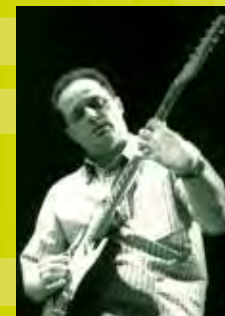
L'estaminet Place Cardinal Mercier, 35 / 21h - 00h